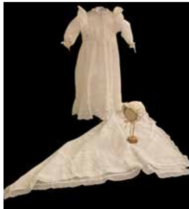
Schenking doopkleed, jurkje en mutsje mevr. Landgraaf