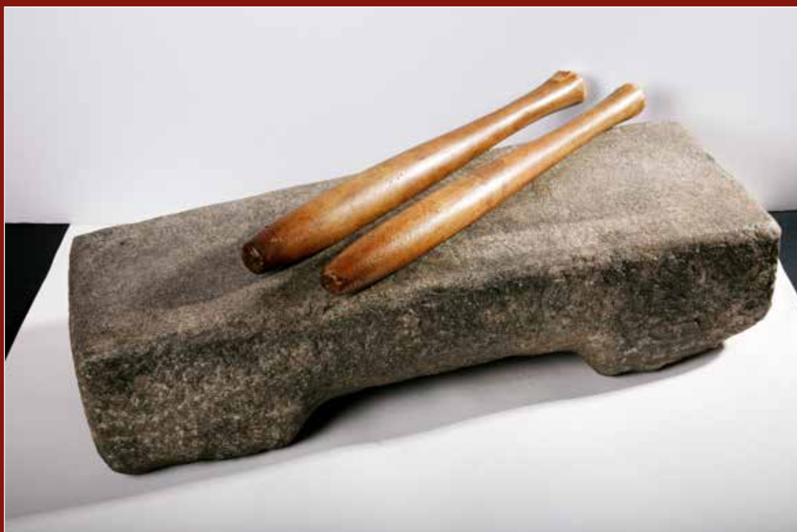
Steen en slagstokken

Ons museum heeft een culturele ANBI-status