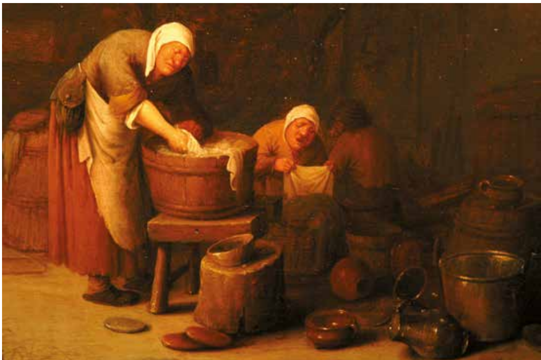
Boereninterieur met vrouwen aan de wastobbe en rokende man als toeschouwer. Bartholomeus Molenaar schilderij uit 1630

Inwoners die zich betrokken voelen bij Museum Vekemans en de missie een warm hart toedragen, nodigen we van harte uit om eens langs te komen. Misschien past de rol van onbezoldigd museumvrijwilliger ook bij u! Schroom niet om telefonisch of per e-mail contact op te nemen. U wordt met open armen ontvangen.