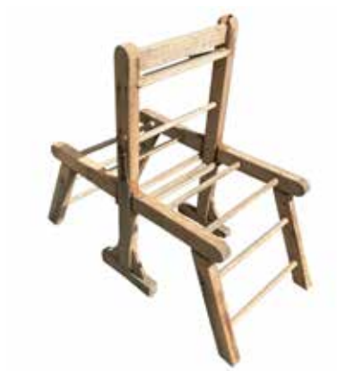
Schenking wasbok Bomans