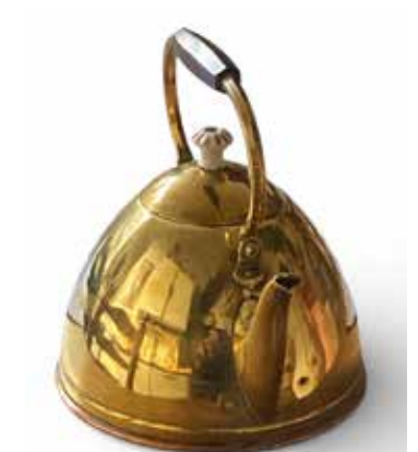
Schenking waterketel mevr. vd Brand