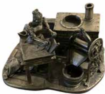
Schenking bronzen beeld fam. Tettero