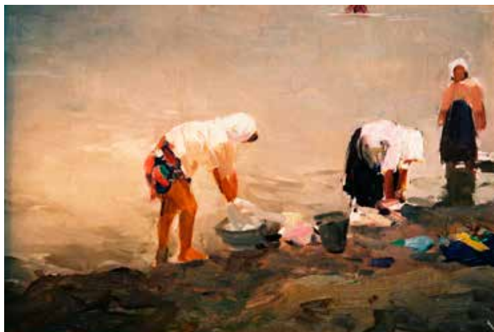
Mikhail Ivanovitch Likahachev

Behalve dat meer bekendheid voor ons museum wordt gerealiseerd, zorgt dit kenniscentrum ook voor een versterking en vergroot het de aantrekkelijkheid ervan voor een latere eventuele overname.